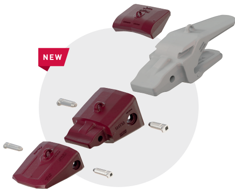
TWINMET 3/2 für Plate Lip-Bagger mit einem Betriebsgewicht von 350 bis 500 t